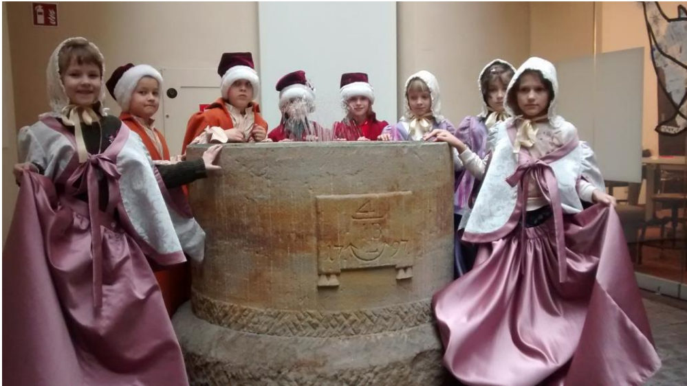
MUZEUM PANA TADEUSZA