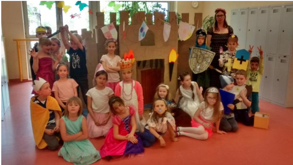
PROJEKT ZAMKU RYCERSKIEGO